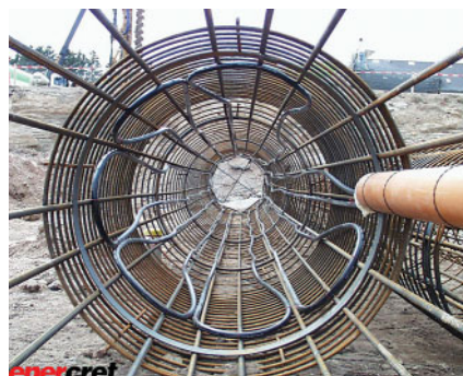
Bild 1: Mit Absorberleitungen belegter Armierungskorb eines Bohrpahles

Bei den ersten Projekten wurden Betonaußenwände von Gebäuden, Garten-