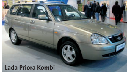
Lada Priora Kombi