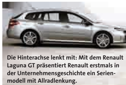
Die Hinterachse lenkt mit: Mit dem Renault Laguna GT präsentiert Renault erstmals in der Unternehmensgeschichte ein Serienmodell mit Allradlenkung.

Daimler-Chef Dr. Dieter Zetsche über den „Wunschpartner“ BMW.