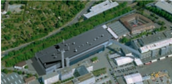
In die neue Zuffenhausener Lackiererei will Porsche bis 2011 rund 200 Millionen Euro investieren.